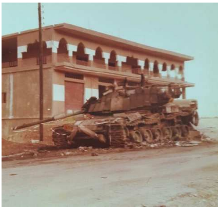
הטנק המוביל של כץ

מיכל הדלק עלה באש (מזל שסולר ולא בנזין). גם הנגמ"ש. התחילו פיצוצים. כנראה של הרימונים, אני לא בטוח. התחילו זיקוקים. פתאום חשתי שאני רואה מחזה כמו בסרט. אבל על אמת. רק רגע! זה מקום מסוכן – אמרתי לעצמי – אתה חייב לזוז כי התחמושת עשויה להתפוצץ ואתה יותר מדי קרוב אליה. הייתי רק שלושה מטרים מהזלדה, והייתי חייב לזוז משם. ממילא המקום מסוכן. לבניין היתה קומה שנייה, חשבתי שראיתי בחלון סורים. אני לא יודע. הלכתי כמה מטרים קדימה ומצאתי את עצמי במין מרפסת, בלקון, שהיתה כניסה לבית. המרפסת נתנה לי מחסה מצד מזרח, מקום האויב, ומצד דרום ממנו באתי. כלפי צפון היתה המרפסת פתוחה, למעט מעקה נמוך. הבית היה באמצע בנייה. מתוך המרפסת הובילה דלת אל הבית פנימה.