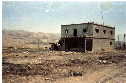
תפסתי מחסה במרפסת החשוכה

הגלגל הלך, והנגמ"ש ניצל. לפי שעה. הנגמ"ש נעצר ליד הבית אליו רציתי להגיע, אך לא הצלחנו ממש כי לא הספקנו להגיב מהר. חלקו הקדמי של הנגמ"ש נמצא מוסתר מן האויב במארב (ממזרח, מימין), בעוד חלקו האחורי של הנגמ"ש בולט מעט החוצה, אחורה, ועדיין נראה לאויב. צעקתי: 'לקפוץ'. נדמה לי שלא היה צורך. כולם קפצו ונעלמו לי. במהירות הבזק. לקחתי את נשקי האישי, שהיה ביני לבין המק"כ (מקלע-כבד, 0.5 אינץ'), וקפצתי למטה. אולי מטר וחצי. זו היתה הפעם האחרונה בחיים שקפצתי. לא ידעתי את זה. נעמדתי סמוך לנגמ"ש,