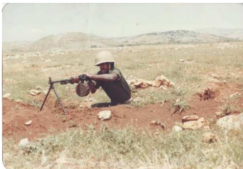
(התמונה נמצאה בכיסו של אחד השבויים)

נזכרתי לפתע. הלא עתה הוא יום ששי. בטח נכנסה שבת. הטיל פגע בנגמ"ש סמוך לשעה 6 בבקר, אך הפגז פגע בי סמוך ל-7 ונותרתי תקוע בשטח עד שהגעתי לחדר-ניתוח בבילינסון בערך בשעה 5 אחר הצהריים. אולי 6. מי יודע. לאחר שנים